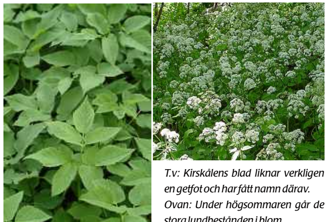
T.v: Kirskålens blad liknar verkligen en getfot och har fått namn därav.