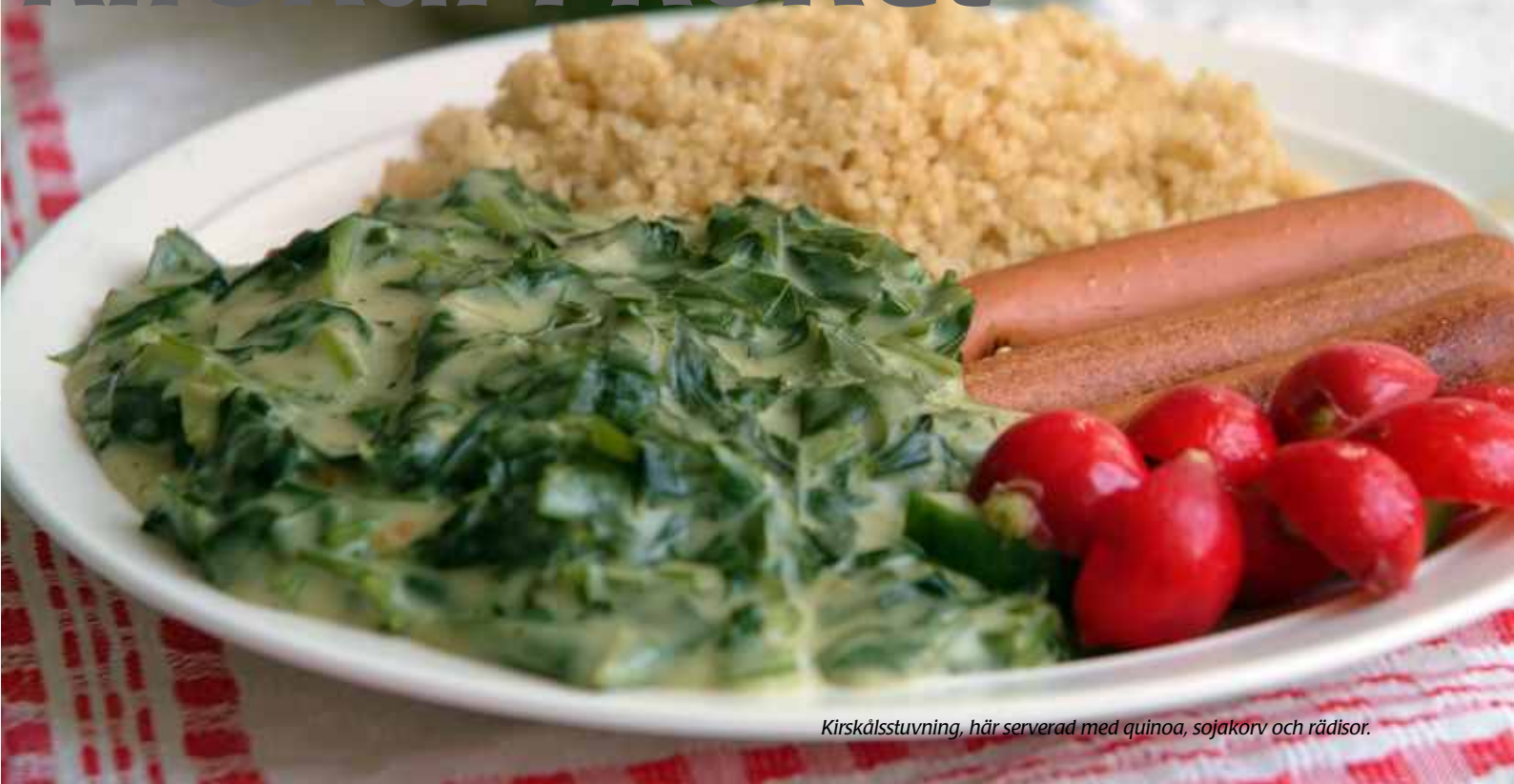
Kirskålsstuvning, här serverad med quinoa, sojakorv och rädisor.